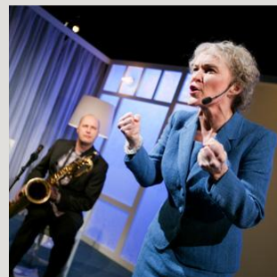
Västerbotten - told, played and portrayed

Inom ramen för utvecklingsprojektet Europas ledande berättarteater/ELB samarbetar